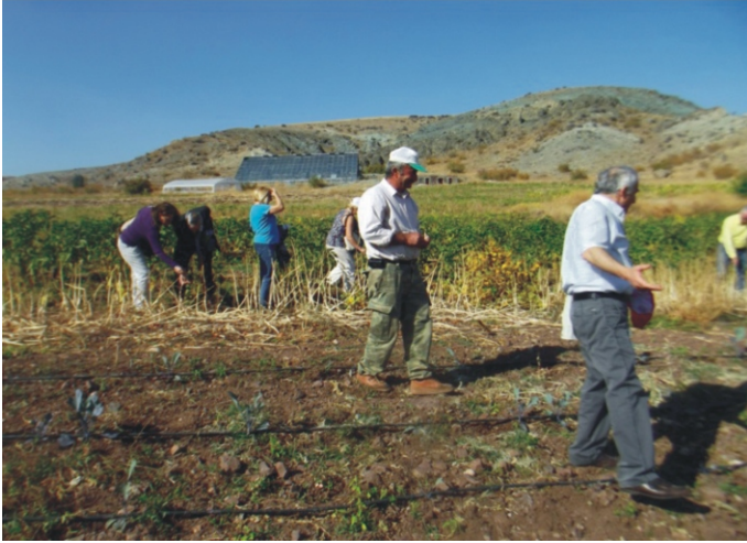
THD tarafından kooperatife yapılan ziyaret ve üretim sahasının bir bölümü