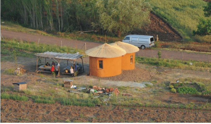
Güneşköy kooperatif girişinde kerpiçten yapılan hizmet evi

Bu yönleri ile Kooperatif, permakültür, organik tarım, biyoçeşitliliğin korunması konularında bölgeye örnek olan ilk proje özelliğini taşımaktadır.