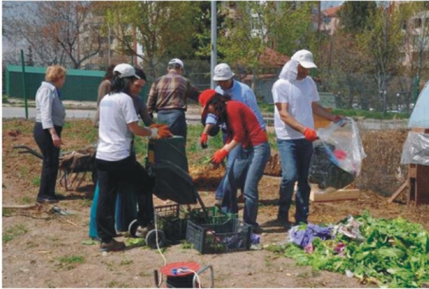
Çiğdemim Derneği Bostanında Bir Çalışma

Uyumlu ve birbirine yarar sağlayan (gölge oluşturma, toprağa besin maddesi sağlama, zararlıları kaçırma, yararlı böcekleri çekme vs.) bitkilerin birbirinin yakınına, uyumsuz bitkilerin ise birbirinden uzağa ekilmesi temeline dayanır. Ekolojik tarım için kullanılacak en etkili yöntemlerden biridir. ( örnek olarak : Soğanlar ve havuçlar yanyana dikildiğinde, hem soğan sineğinden, hem havuç sineğinden korunurlar)